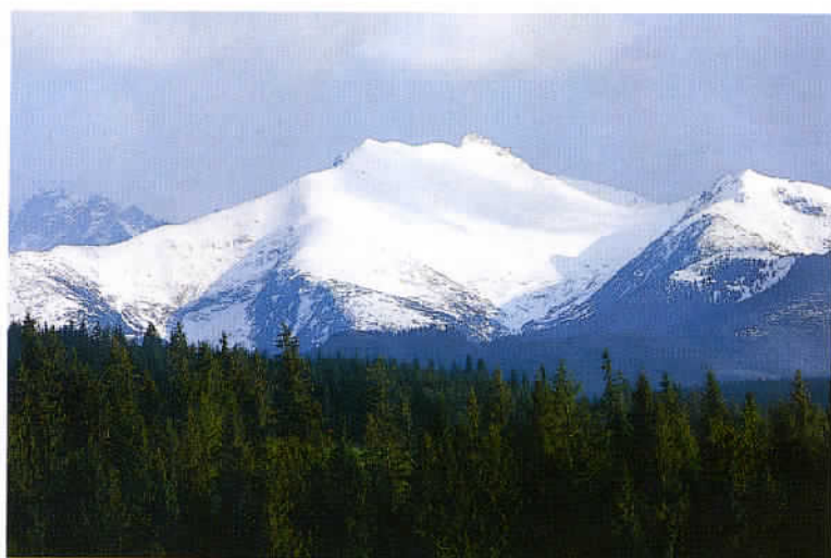
Le parc national des Tatras, le plus fréquenté de Pologne. Zakopane «capitale d'hiver» attire skieurs, alpinistes, curistes et artistes. Un haut lieu du tourisme.