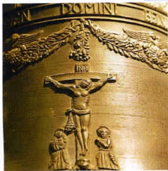
A Przemysl, le musée des cloches dans la tour de l'horloge, dont le sommet offre une vue panoramique.