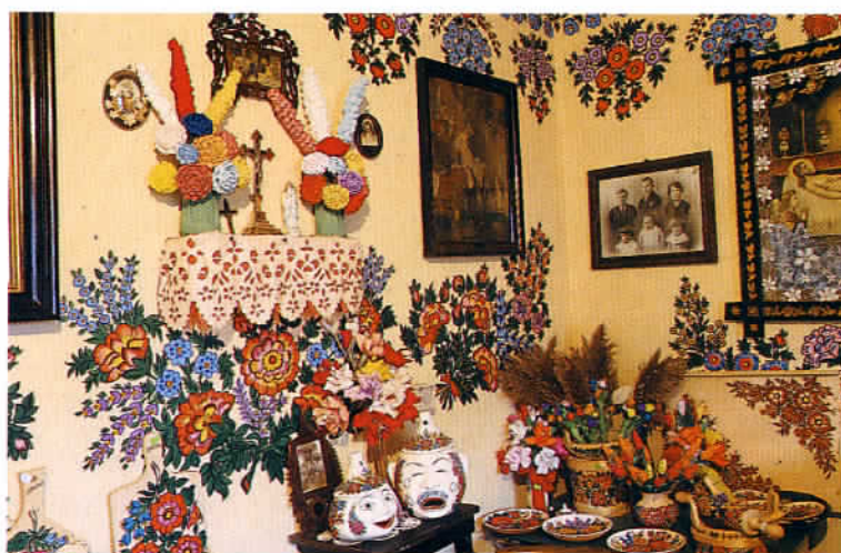
L'intérieur du musée de Zalipie. Le village perpétue la tradition des maisons peintes avec l'organisation d'un concours annuel de la plus belle décoration murale.