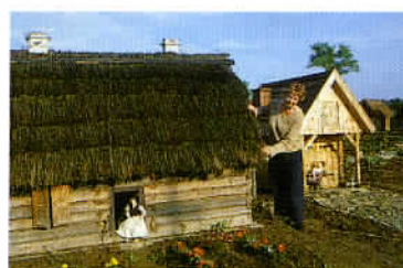
Le skansen et le musée Lalek à Piłzno méritent vraiment le déplacement.

avec ses châteaux et parcs naturels, via Nowy Sącz. Notre prochaine étape se trouve à Sanok, près de la frontière ukrainienne. Sanok, qui est jumelée avec la commune de Cestas en Gironde, forme une bonne introduction à la découverte des Carpates polonaises, les Bieszczady. La ville en elle-même possède deux arguments touristiques forts : en premier lieu un château reconverti en iconothèque de tout premier ordre, probablement la plus belle que nous ayons vu durant ce voyage en Pologne. A noter en plus de toutes les incompa-