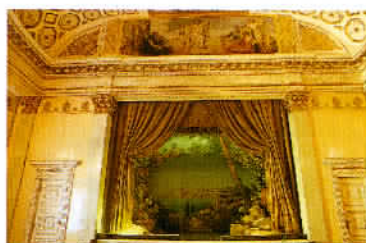
Dans le château de Łańcut, le petit théâtre, un joyau baroque de 80 places.

gérons un mode de transport original et écologique : la descente en radeau de la rivière Dunajec. Une navigation tranquille à bord d'une embarcation traditionnelle en bois, qui dure deux heures. Le tout à travers le parc national des Pieniny, sur les hauteurs duquel se trouvent les châteaux forts de Niedzica et Czorsztyn. Et à l'arrivée, quoi de mieux que la dégustation d'une délicieuse truite de rivière servie sur la terrasse du restaurant au bord de la rivière, à Szczawnica ? Un pur régal. Ensuite, cap sur la province des Précarpatés