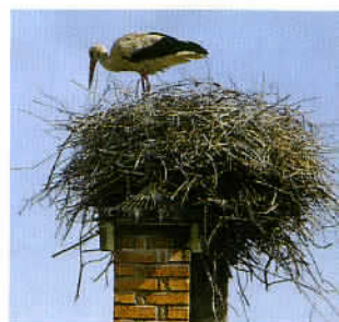
La cigogne, une espèce protégée en Pologne.