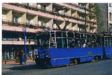
A Cracovie, les tramways sont toujours prioritaires. Un bon moyen de transport et de visite.

de bars et restaurants où passer du bon temps. La place du marché située en plein centre ville illustre à merveille la concomitance de la culture, de l'histoire et du plaisir. En effet, de la spectaculaire église Notre Dame à la flèche féerique grâce à sa remarquable illumination nocturne, à la Halle aux Draps reconverte en marché touristique où l'on trouve de l'artisanat à des prix défiant toute concurrence... en passant par la tour de l'hôtel de ville et les multiples établissements de différents standings de la place et des rues