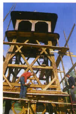
Des charpentiers perpétuent la tradition des églises en bois, dans un pays où la vie politique et sociale demeure sous influence catholique.