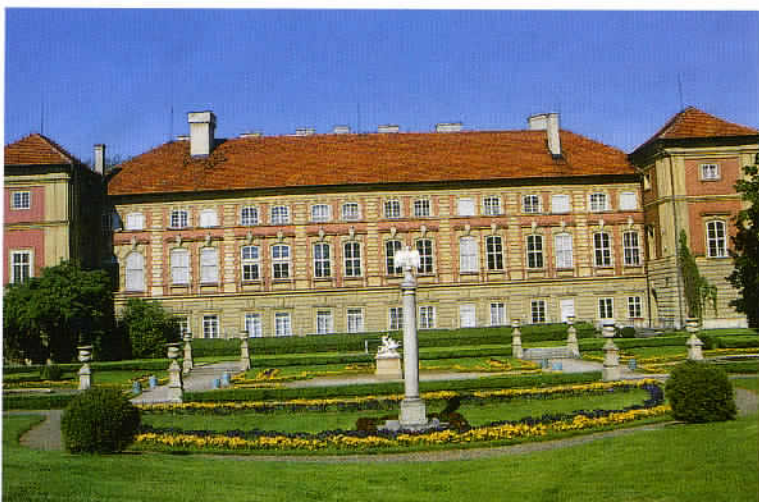
Le Château de Łańcut, certainement la résidence aristocratique la plus connue de Pologne, riche de collections exceptionnelles, est entouré d'un magnifique parc.