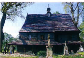
L'une des nombreuses églises construites en bois classée par l'UNESCO.

de bars et restaurants où passer du bon temps. La place du marché située en plein centre ville illustre à merveille la concomitance de la culture, de l'histoire et du plaisir. En effet, de la spectaculaire église Notre Dame à la flèche féerique grâce à sa remarquable illumination nocturne, à la Halle aux Draps reconverte en marché touristique où l'on trouve de l'artisanat à des prix défiant toute concurrence... en passant par la tour de l'hôtel de ville et les multiples établissements de différents standings de la place et des rues