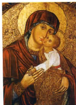
L'une des 700 icônes ruthènes du musée de Sanok.