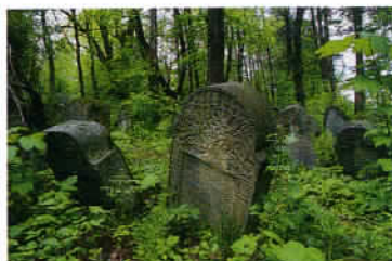
Le cimetière juif de Sanok, une ville qui comptait une importante communauté avant guerre.

avant de partir à la découverte des Bieszczady pour mieux en comprendre les stratifications ethniques et religieuses. Ensuite, les Carpates offrent beaucoup de possibilités de randonnées pédestres, de visites d'églises en bois et de promenades en tout-chemin. Puis nous vous proposons ni plus ni moins que de résider au château de Krasiczyn, que la modicité du coût de la vie en Pologne met à portée de quasiment toutes les bourses françaises. Ainsi, il est possible de conjuguer une hôtellerie de haut niveau et la visite de l'une des perles de la renaissance polonaise avant d'aborder Przemyśl, une autre ville située à proximité de l'Ukraine et qui connut les turbulences de l'histoire de l'ancienne Galicie, annexée en