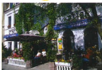
Une terrasse de café dans le quartier de Kazimierz, naguère secteur juif de Cracovie.

adjacentes, chacun peut trouver son bonheur à Cracovie, en matière de visite et de dégustation en tout genre. Un autre temps fort culturel local : la colline de Wawel, l'un des véritables cœurs historiques de la Pologne avec, notamment, sa cathédrale gothique et son château, jadis résidence des rois de Pologne, qui héberge aujourd'hui de nombreuses œuvres d'art. Enfin, pour clore un inventaire forcément non exhaustif compte tenu de la richesse du patrimoine de Cracovie, nous vous proposons de flâner dans le quartier de