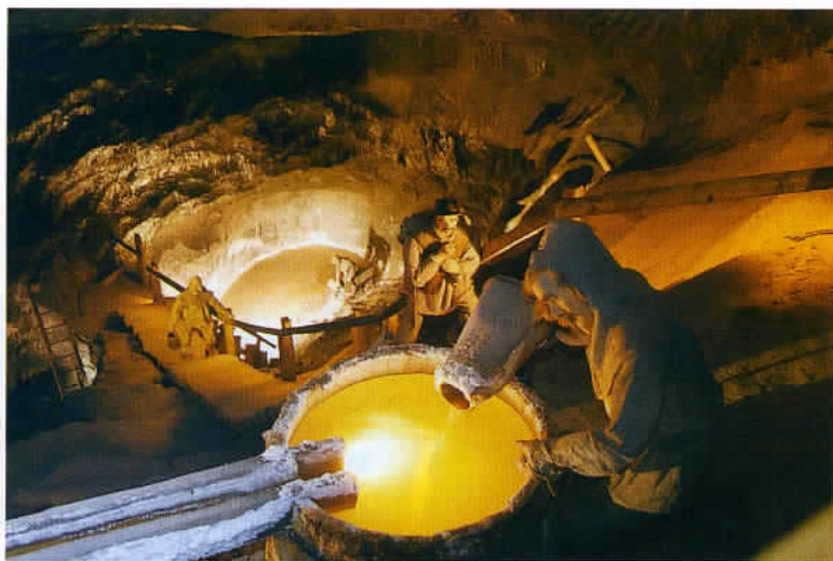
La mine de sel de Wieliczka, à 13 km au sud-est de Cracovie, a été inscrite au patrimoine mondial de l'UNESCO en 1978. A voir absolument.

Un exemple de la ferveur religieuse des Polonais, dont plus de 80 % se déclarent catholiques pratiquants : une église trop exigüe pour l'ensemble de ses fidèles.