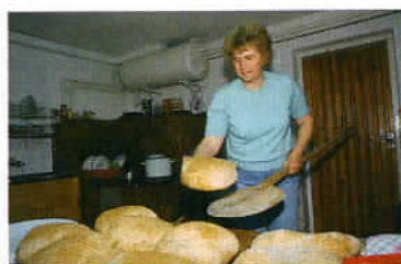
Une boulangerie artisanale à Kostrzynska Danuta, à proximité de Tarnow.

avant de partir à la découverte des Bieszczady pour mieux en comprendre les stratifications ethniques et religieuses. Ensuite, les Carpates offrent beaucoup de possibilités de randonnées pédestres, de visites d'églises en bois et de promenades en tout-chemin. Puis nous vous proposons ni plus ni moins que de résider au château de Krasiczyn, que la modicité du coût de la vie en Pologne met à portée de quasiment toutes les bourses françaises. Ainsi, il est possible de conjuguer une hôtellerie de haut niveau et la visite de l'une des perles de la renaissance polonaise avant d'aborder Przemyśl, une autre ville située à proximité de l'Ukraine et qui connut les turbulences de l'histoire de l'ancienne Galicie, annexée en