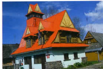
Le village d'architecture en bois de Chocholow avec ses superbes maisons pittoresques.

1939 par l'URSS. A Przemyśl, il convient de visiter le musée d'archéologie, encore quelques églises, le musée des cloches et des pipes mais surtout, à quelques kilomètres en dehors de la ville, le magnifique arboretum de Bolestraszycy. Créé en 1975, il regroupe 4 000 espèces de plantes dans un cadre enchanteur, entretenu par une trentaine d'employés dirigés par un artiste-naturaliste opportunément prénommé Narcisse. Ce dernier en a fait aussi un site d'exposition d'œuvres inspirées par la nature et intégrées à l'environnement. Un authentique outil de sensibilisation à l'écologie. A Przemyśl, nous avons également trouvé le meilleur restaurant de notre voyage : chez Madame Tomaszewska, un cadre raffiné pour une cuisine qui ne l'est pas moins, l'ensemble dirigé par une charmante hôtesse, dans une maison qu'elle a fondée