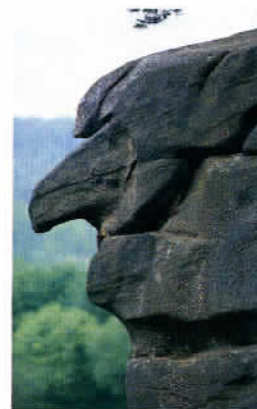
Un rocher baptisé «la sorcière» près de Cieszkowice.