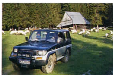
La Pologne reste un pays de tradition agricole et d'élevage, notamment ovin.