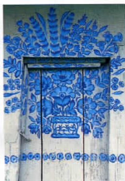
Un motif floral du musée de Zalipie.