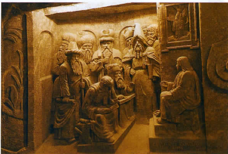
Toujours à Wieliczka, dans la chapelle de la Bienheureuse Kinga, le détail d'une frise sculptée dans le sel. Le temps fort de la visite.